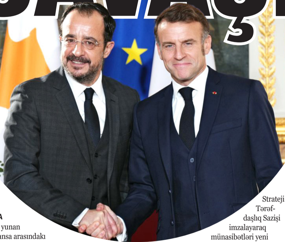
Strateji Tərəfdaşlıq Sazişi imzalayaraq münasibətləri yeni mərhələyə yüksəldilər.