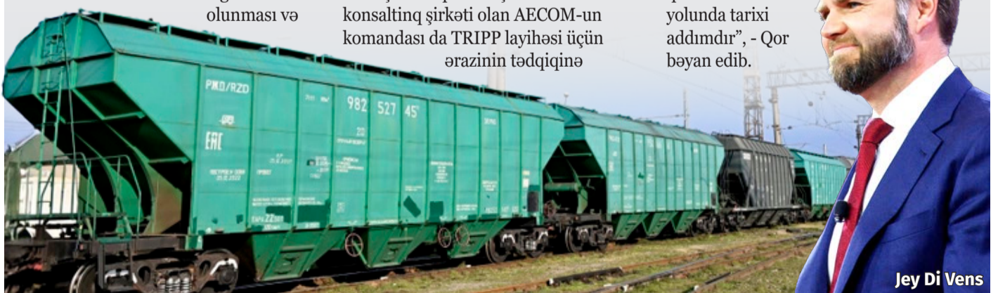
Jey Di Vens

"Ermənistan və Azərbaycanı birləşdirən tarixi sülh sammitindən bəri biz "Tramp Marşrutu"nu (TRIPP) təşviq etməyə davam edirik. Bu marşrut Mərkəzi Asiyadan Cənubi Qafqaz vasitəsilə və daha sonra Qərbdə birbaşa nəqliyyat əlaqəsini təmin edəcək. Bu, güclü qarşılıqlı əlaqəli iqtisadiyyatların yaradılması və regionda davamlı sülhün qorunması yolunda tarixi addımdır", - Qor bəyan edib.