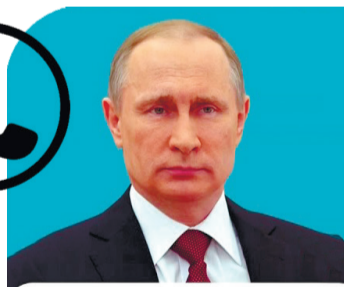
VLADİMİR PUTİN RUSİYA FEDERASIYASININ PREZİDENTİ