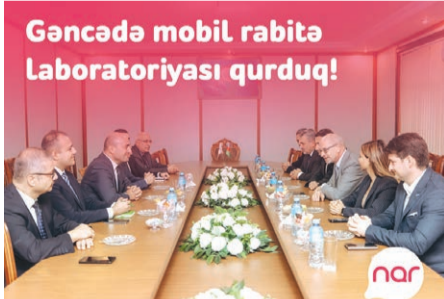
Gəncədə mobil rabitə laboratoriyası qurduq!

Laboratoriyanın açılışı zamanı "Nar" in (Azerfon MMC) baş icraçı direktoru Qunnar Panke bildirib: "Bu laboratoriya "Nar" olaraq, bölgələri diqqətdə saxlamağımızın növbəti nümunəsidir. Texnoloji tərəqqi ilə ayaqlaşan biznes olaraq,