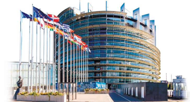
Avropa Parlamenti binası, Brüssel, Belçika

Lakin buna müqavimət də var. Avropa ölkələrinin radikal kəsimi artıq mənəvi dəyərlərin itirilməsi təhlükəsini daha ciddi şəkildə gündəmə gətirir. Qərb nəşrlərində ara-sıra "dəhşətli LGBT təhlükəsi"ndən bəhs edirlər. Avropa Parlamentinin LGBT Hüquqları Müdafiəçiləri Platformasının dərc etdiyi sənədlərdə bildirilir ki, son yeddi ildə Avropada LGBT icmasına mənsub olduqlarını bildirenlərin sayı beş dəfə artıb. Avropa bu "dəyərləri"ni bütün dünyaya ixrac etmək və öz daxilində ciddi demoqrafik problemlərə gətirib çıxaran bu tendensiyanı bütün