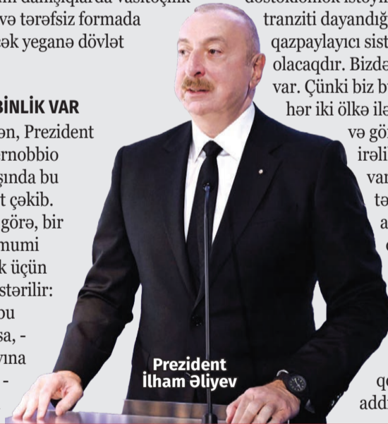
Prezident İlham Əliyev

İttifaqı ölkəsi təbii qazın fiziki ölçəcanlığı ilə bağlı ciddi çətinliklərlə üzləşəcək. Biz, sadəcə, həmin ölkələri və Ukraynanı dəstəkləmək istəyirik. Çünki qazın tranziti dayandığı halda Ukraynanın qazpaylayıcı sistemi tamamilə iflic olacaqdır. Bizdə müəyyən nikbinlik var. Çünki biz bu kontekstdə hər iki ölkə ilə təmasdayıq və görürük ki, ciddi irəliləyiş üçün zəmin var. Ancaq tərəfimdən təfərrüatların açıqlanması erkən olar. Burada uğura nail ola bilsək, zənnimcə biz bütün regionu viran edən bu müharibəyə son qoymaq üçün əlavə addımlar ata bilərik".