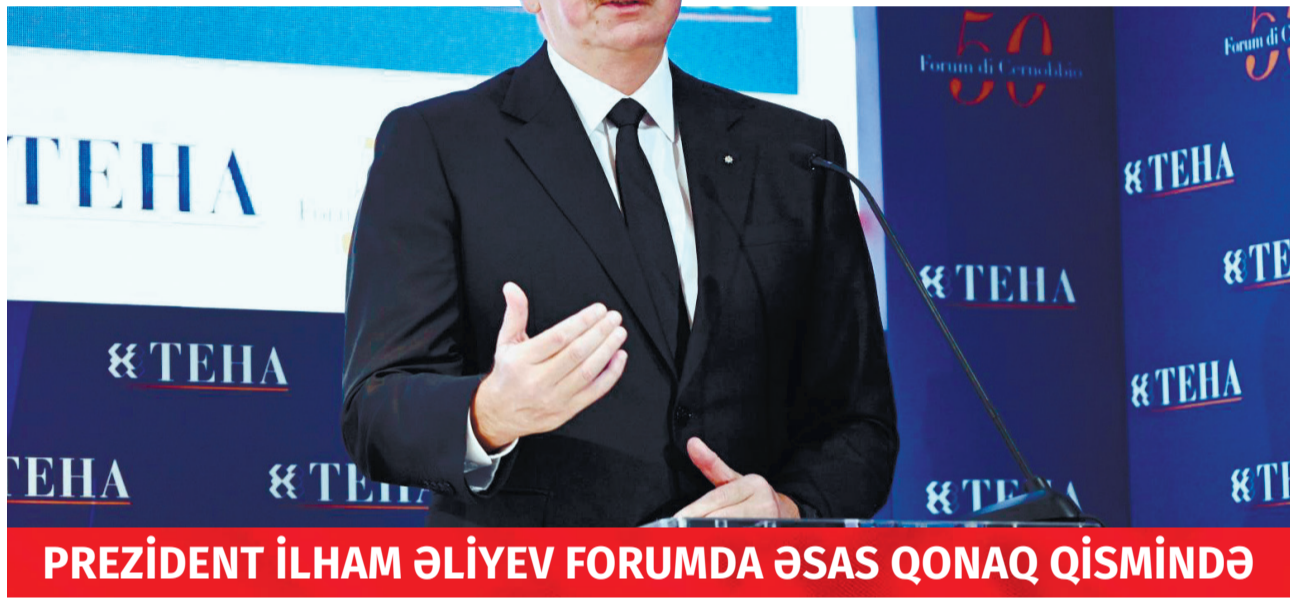
PREZİDENT İLHAM ƏLİYEV FORUMDA ƏSAS QONAQ QISMİNDƏ