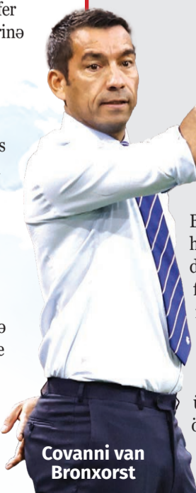
Covanni van Bronxorst

İstanbul klubu bu yay, həmçinin, əsas rəqibi "Fənərbəğça"dan Miçi Batşuayini azad agent kimi heyətinə cəlb etdi. Osimhen, İnkardi, Batşuayini və Hakim Ziyəş ilə komandanın hücum xətti qorxulu görünür. Yarım müdafiə xəttinə isə Qabriel Sara cəlb olunub. Braziliyalı üçün İngiltərə "Norviç"inə 18 milyon avro ödənilib. Komandanı tərk edənlər də var. Kerem Aktürkoğlu "Benfika"ya, Tete "Panatinaikos"a satılıb. Nikolo Zaniolo "Atalanta"ya, Ülfrid Zaha isə "Lion"a icarəyə verilib. Ümumilikdə yeni transferlərə 28 milyon avro xərcləyən "Qalatasaray" satışlardan daha çox - 33 milyon avroya yaxın vəsait əldə edib.