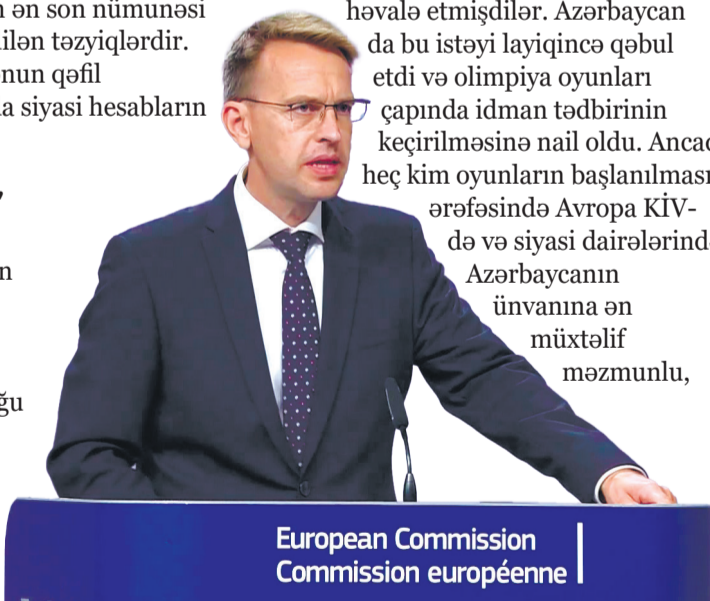
European Commission Commission européenne

Avropanın müxtəlif strukturları tərəfindən Azərbaycanın ünvanına səslənən ədalətsiz bəyanatların, hətta embarqo, sanksiya hədələrinin arxasında hansı qüvvələrin, daha doğrusu, hansı dövlətin durduğu sirr deyil. 44 günlük müharibədən sonra Aİ, Avroparlament kimi qitə institutları Fransanın Azərbaycana qarşı təzyiç cəhdləri üçün rüporə çevriliblər. Cənubi Qafqazda Ermənistanla birlikdə Fransanın da Azərbaycana məğlub olmasını təbii ki, Parisdə həzm edə bilmirlər. İndi isə fransız şovinizmi Azərbaycan tərəfindən tamamilə fərqli, qeyri-ənənəvi coğrafiyada tərs şilləyə "qonaq" olub - uzaq Yeni Kaledoniya və Polineziyada. Bakı öz müqəddəratlarını özləri həll etmək istəyən, fransız müstəmləkəçiliyindən qurtulmağa çalışsın, Parisin yekəxana, eqoist istibdadına "yox" deyən kiçik dövlətlərin və xalqların özünüifadəsi üçün effektiv platformaya çevrilib.