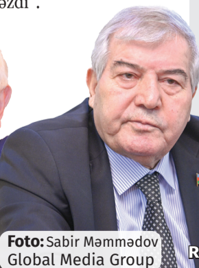
Sabir Rüstəmخانlı