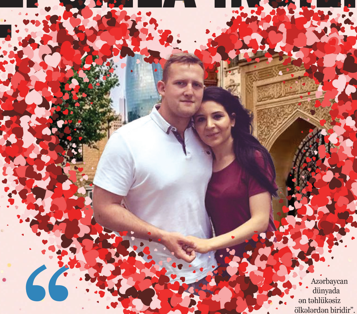
Azərbaycan dünyada ən təhlükəsiz ölkələrdən biridir”.