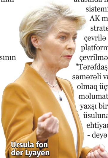
Ursula fon der Lyayen

Avropada ABŞ-nin Mərkəzi Kəşfiyyat İdarəsinə bənzəyən yeni kəşfiyyat orqanının yaradılması diqqət mərkəzindədir. Avropa Komissiyası (AK), Avropa İttifaqı (Aİ) nə qədər təzkib etsə də, mediada, siyasi dairələrdə bu məsələnin müzakirəsi getdikcə artır. Məlum olan sadəcə odur ki, AK Aİ Baş Katibliyi strukturunda kəşfiyyat bölməsi formalaşdırmağa başlayıb. Bu barədə Britaniyanın "Financial Times" nəşri dörd mənbəyə istinad edərək məlumat yayıb. Ehtimal olunur ki, bu orqan Aİ-nin bütün dövlətlərinin kəşfiyyatlarından məlumatların toplanması və təhlili üçün mərkəzləşdirilmiş sistemin yaradılmasının ilk mərhələsi olacaq. Ona Aİ Komissiyasının başçısı Ursula fon der Lyayen rəhbərlik edəcək. Prosesə Avropa ölkələrinin kəşfiyyatlarının, məsələn, Fransa